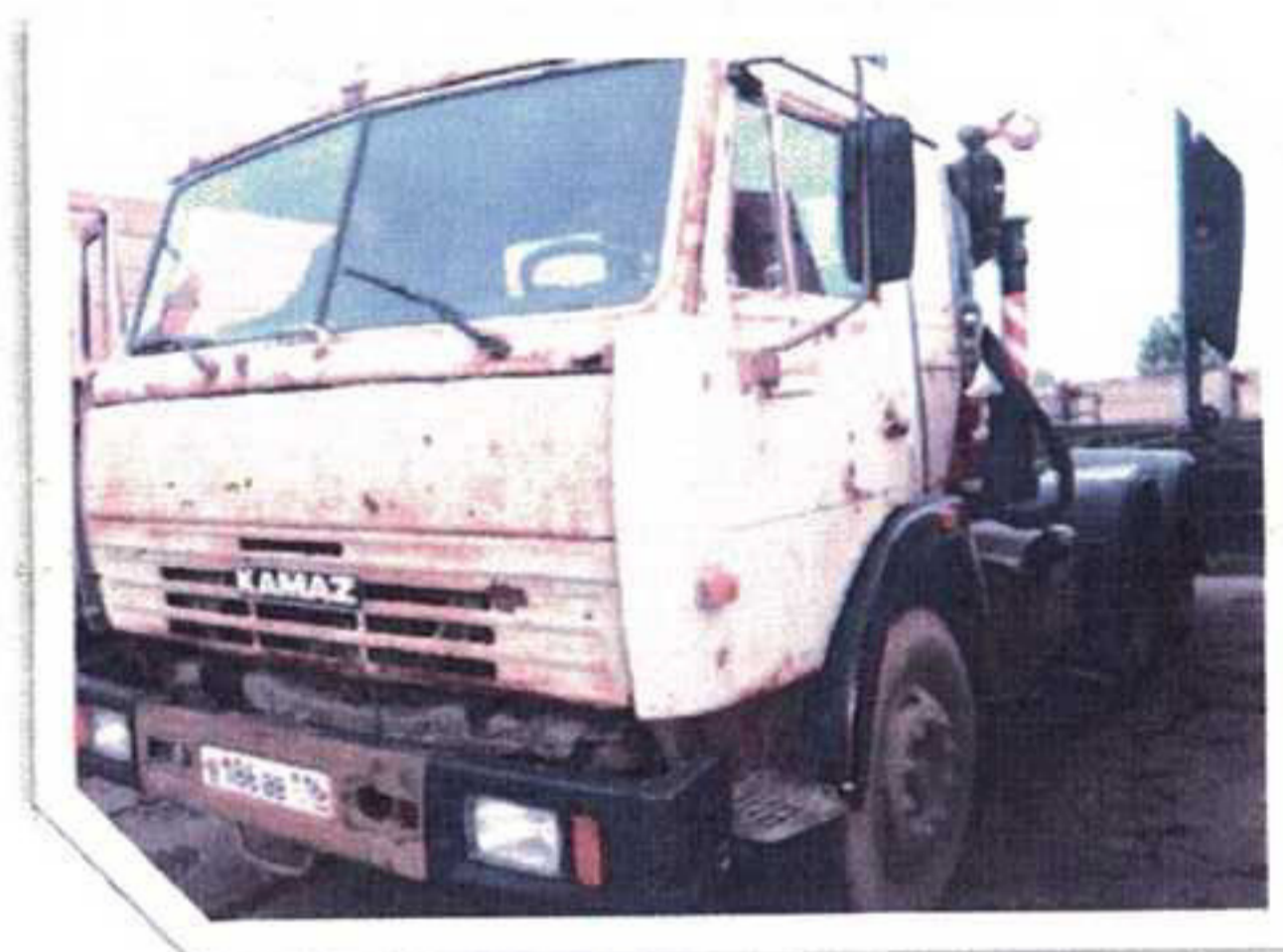
До капитального ремонта