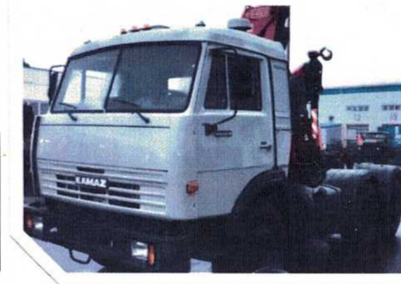
После капитального ремонта